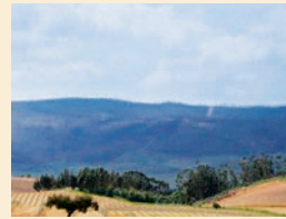
SERRA D'OSSA Para los amantes de la naturaleza la descubierta de Serra d'Ossa es siempre sorprendente. Con una altitud máxima de 650

Siguiendo en un periplo por los templos rurales de este municipio, la Iglesia de Nossa Senhora da Orada, en aquella parroquia, es considerada como el local donde Nuno Álvares Pereira oró antes de la partida para la Batalla de los Atoleiros, en 1384. En Río de Moinhos, en la pintoresca aldea de San Gregório se alza una ermita, con el mismo nombre, que habrá sido fundada en 1556 por un zapatero. Allí en aquella aldea, recientemente reconstruida, sugerimos un paseo pedestre alrededor de la Sierra d' Ossa. También en esta planicie alentejana aconteció, en 1655, la Batalla de Montes Claros, el último combate de la Guerra de la Restauración que colocó, frente a frente, las tropas españolas del Conde de Caracena y el ejército organizado por el Conde de Castelo Melhor.